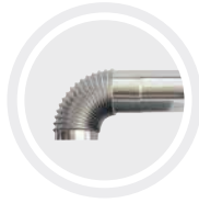
Ducto de evacuación de gases